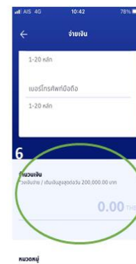
6: ระบุจำนวนเงินตามสิทธิที่ต้องการจะใช้และเลื่อนลงไปด้านล่างเพื่อดำเนินการลำดับถัดไป