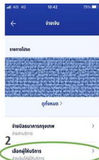
2: เลือกผู้ให้บริการ