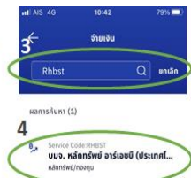
4: เลือกบมจ. หลักทรัพย์ อาร์เอชบี (ประเทศไทย) เพื่อการจองซื้อหลักทรัพย์