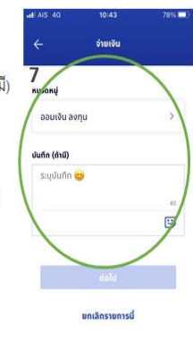
7: บันทึกข้อความส่วนตัว (ถ้ามี)