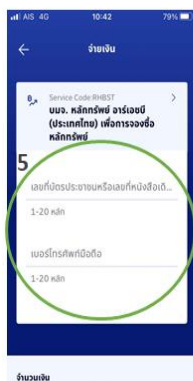
5: ระบุหมายเลขบัตรประชาชน หมายเลขโทรศัพท์มือถือ และเลื่อนลงไปด้านล่างเพื่อดำเนินการลำดับถัดไป